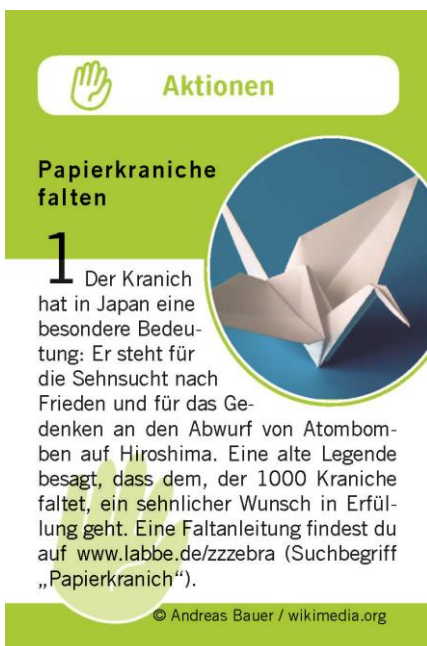
Friedensquartett Kategorie „Aktionen“