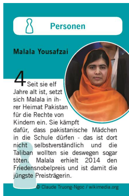
Friedensquartett Kategorie „Personen“

Weitere Abbildungen der Spielkarten können Sie hier bestellen: